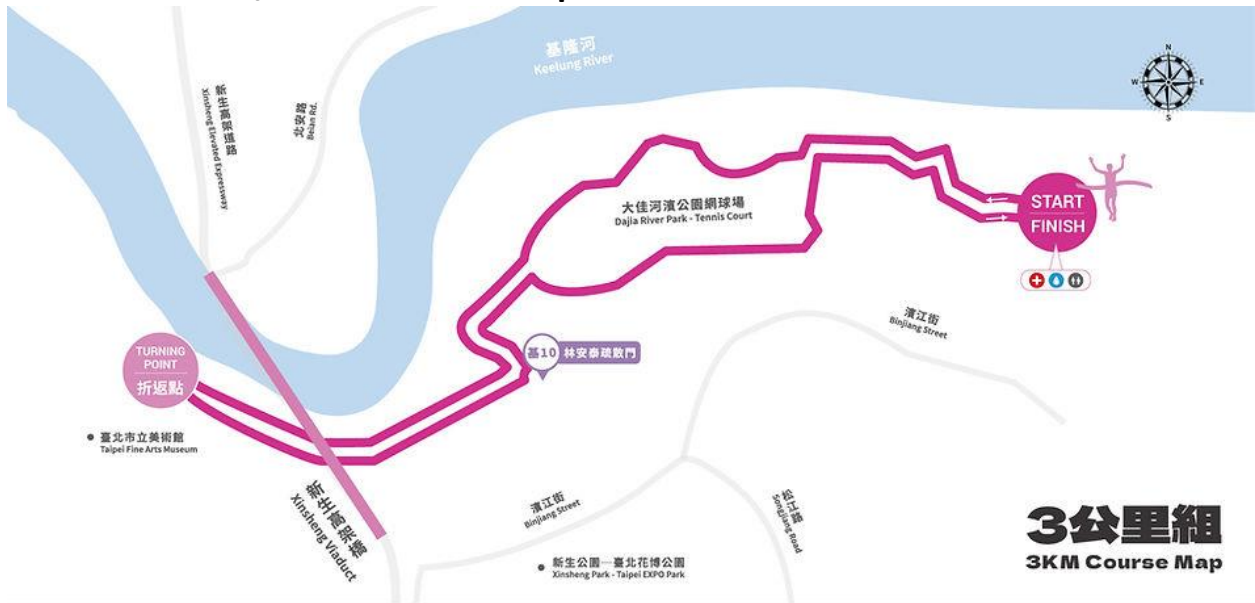
3公里組 3KM Course Map